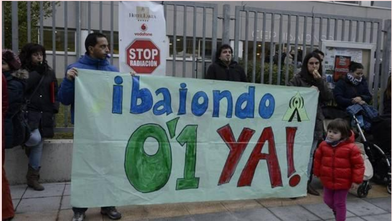
Familias de la ikastola Ibaiondo en Gasteiz.